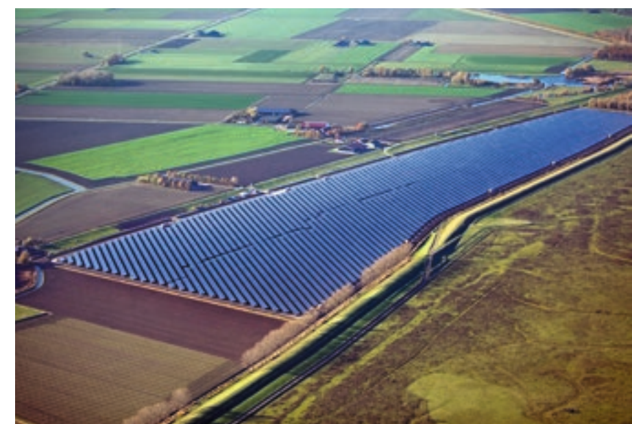
Zonnepanelen in Zuid-Holland

De provincie Zuid-Holland wil met de strategie 'Weerkrachtig Zuid-Holland' het klimaatprobleem voor zijn. Zij trekt extra geld uit voor klimaatadaptatie. Op 4 oktober 2018 is het convenant 'Klimaatadaptief bouwen' getekend door veertig publieke en private partijen. Zij zetten in op klimaatadaptatieve gebiedsontwikkeling met ruimte voor natuur en water - niet alleen in de buitengebieden, ook in de steden - en op energie-neutrale woningbouw. Provincie en bedrijfsleven hebben ook besloten alles op alles te zetten om de Rotterdamse haven en het glastuinbouwcluster CO2-neutraal te krijgen in 2050. Dit betekent dat de provincie fors investeert in warmtenetten en een CO2-smartgrid, waarmee CO2 van de haven naar de kassen in het Westland kan worden getransporteerd. MKB-Nederland en VNO-NCW hebben waardering voor dit ingezette beleid, maar zien ook graag dat er na de verkiezingen oog is voor de beperkte financiële middelen van het midden- en kleinbedrijf voor de energietransitie. Ondernemers van ongeveer vijfhonderdduizend bedrijfsgebouwen zouden een aanbod moeten krijgen om CO2-besparende maatregelen te nemen. Ook al kunnen die maatregelen binnen vijf jaar worden terugverdiend,